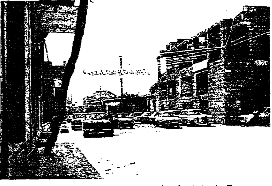
احد شوارع قربيا .. ومركز البلدية